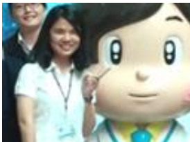
嘉南藥理大學 胡同學